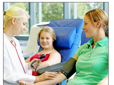
Blutspender sind verantwortungsvolle Mitbürger.

Auch in den Sommerferien muss die Behandlung der Patienten mit Blutpräparaten gesichert sein. Der DRK-Blutspendedienst Baden-Württemberg-Hessen bittet deshalb dringend um Blutspenden am Dienstag, 3. September von 11.30 Uhr bis 19.30 Uhr im Universitäts-Herzzentrum Freiburg Bad Krozingen (Südring 15). Für den in der Gymnastikhalle stattfindenden Termin wird um Anmeldung im Patienten-Informations-Zentrum (PIZ) unter 0 76 33 / 4 02 53 00 (in der Zeit von 10 bis 15 Uhr) gebeten. Infos: www.blutspende.de .